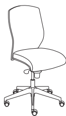
53321 h1100 . d680 . w680