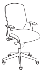
53320 h1100 . d680 . w680

Stets bereit für jeden Anlass. Perfekt geeignet für harte Arbeit und Entspannung, nützlich für Studium und Vergnügen. Egonomic ist der richtige Stuhl für all jene, die den eigenen Stil im Laufe des Tages ändern und dabei auf einen schlichten, aber bequemen Stuhl nicht verzichten wollen. Einfach perfekt unter allen Bedingungen.